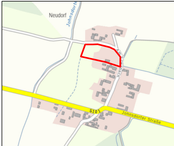
Abbildung 2 Topographische Karte, Plangebiet: rot umrandet