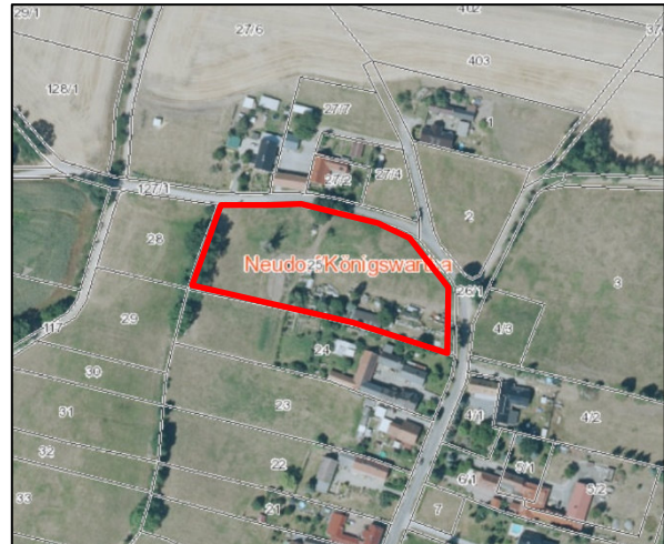
Abbildung 1 Luftbild, Plangebiet: rot umrandet

Der Geltungsbereich dieses Bebauungsplanes „Neudorf – Am Erlenbach“ umfasst das Flurstück 25 der Gemarkung Neudorf/Königswartha mit einer Gesamtfläche von ca. 8.890 m 2 . Gemäß den Regelungen dieses Bebauungsplanes dürfen im Geltungsbereich partiell, innerhalb festgesetzter Baufenster drei Einfamilienhäuser und eine Wirtschaftsstelle für die Forst- bzw. Landwirtschaft (Technikgebäude) errichtet werden.